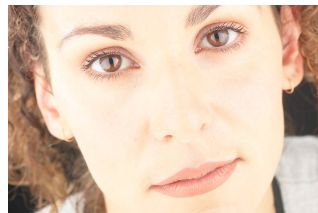
រកអ្នកជួយគាំទ្រ